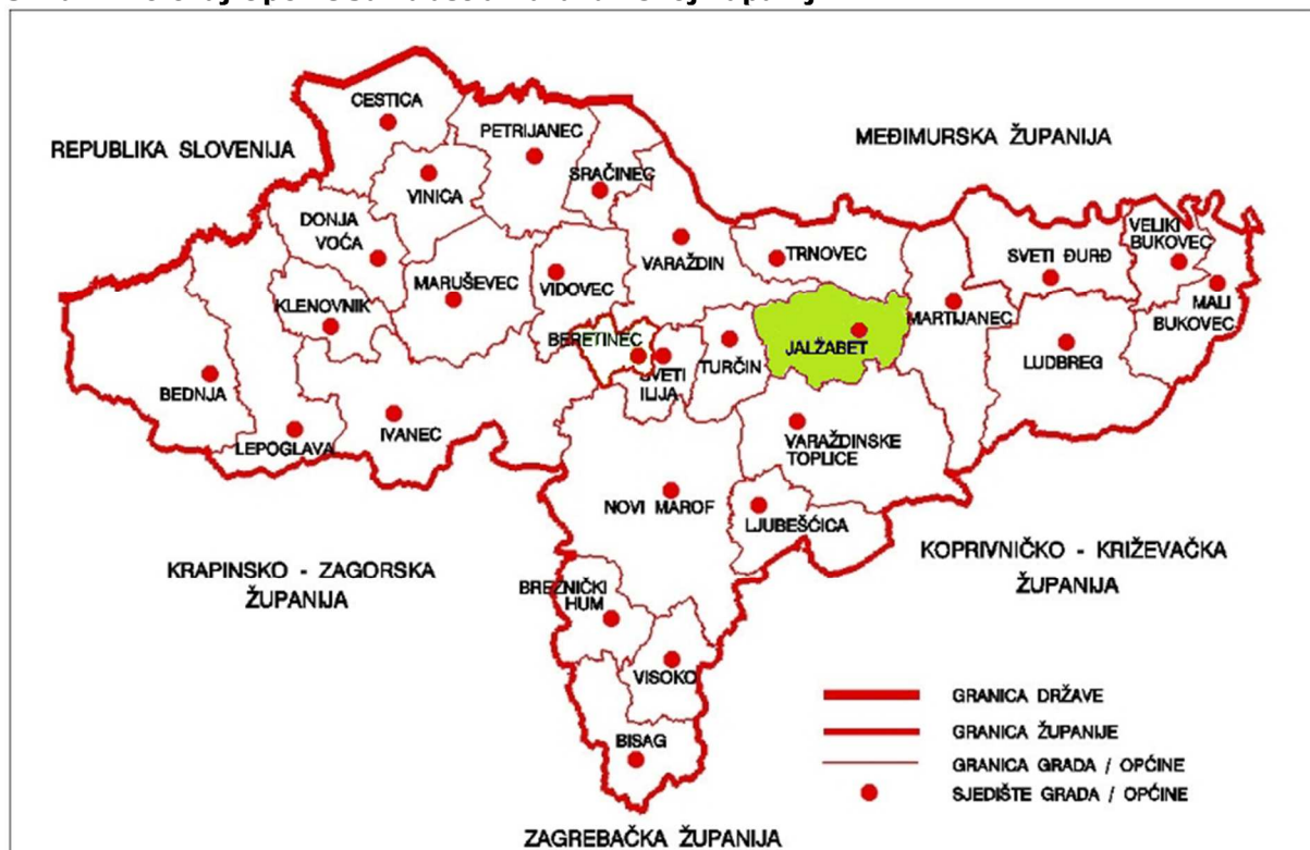
Slika 1: Položaj Općine Jalžabet u Varaždinskoj županiji

Područje općine Jalžabet, sa 38 četvornih kilometara, ima vrlo povoljan prostorno-prometni položaj koji mu omogućuje brz i kvalitetan razvoj. Naselja su smještena na obroncima vinorodnih brežuljaka Topličkog gorja s kojih se pruža prekrasan pogled prema Varaždinu, te rijekama Plitvici i Dravi. Naselja su međusobno, te sa županijskim središtem Varaždinom, cestovno dobro povezana, a blizina željezničke pruge Varaždin-Zagreb-Rijeka, te posebno gradnja autoceste Zagreb-Goričan-Budimpešta, Općinu Jalžabet na prometnoj su karti stavili na istaknuto mjesto 1 .